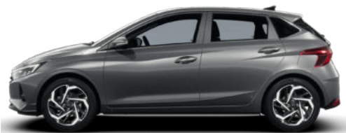
Aurora Gray Pearl