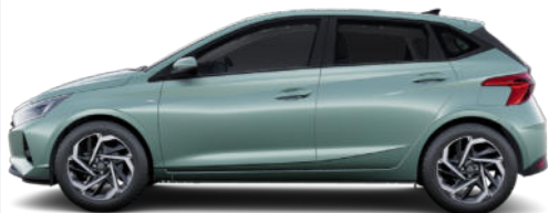
Mangrove Green Pearl

Kontrastdach verfügbar / nicht für N Line