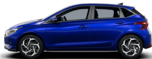
Intense Blue Pearl