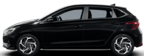
Phantom Black Pearl