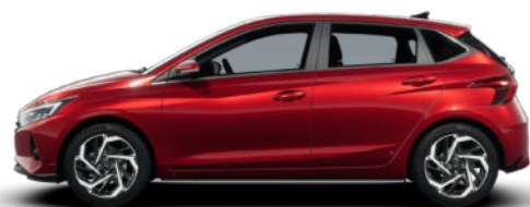
Dragon Red Pearl