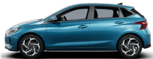
Aqua Turquoise Metallic