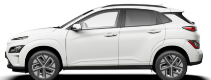
Serenity White Pearl Kontrastdach verfügbar