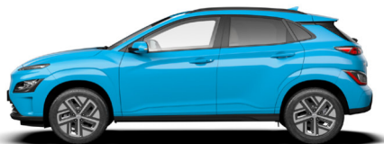
Dive Blue Kontrastdach verfügbar