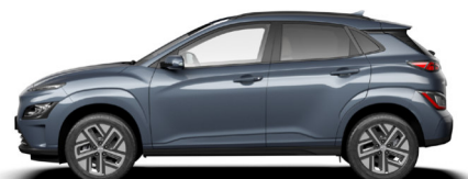
Dark Teal Metallic Kontrastdach verfügbar