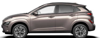
Silky Bronze Metallic Kontrastdach verfügbar