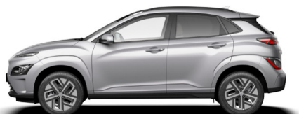
Shimmering Silver Metallic Kontrastdach verfügbar