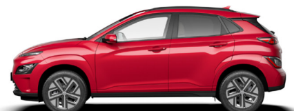
Sunset Red Pearl Kontrastdach verfügbar