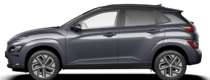
Dark Knight Gray Pearl* Kontrastdach verfügbar