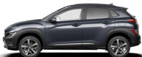
Dark Knight Gray Pearl Kontrastdach verfügbar