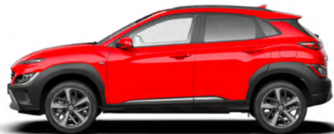
Ignite Red Kontrastdach verfügbar