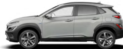
Cyber Gray Metallic Kontrastdach verfügbar