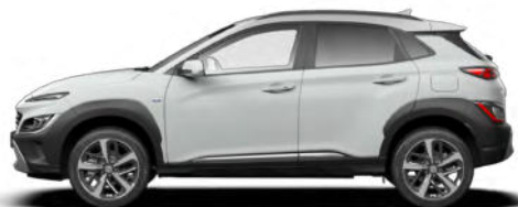
Atlas White Kontrastdach verfügbar