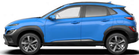
Surfy Blue Metallic Kontrastdach verfügbar