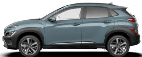
Jungle Green Pearl Kontrastdach verfügbar