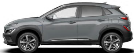
Galactic Gray Metallic Kontrastdach verfügbar