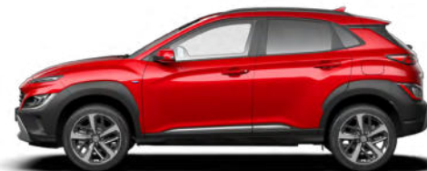
Pulse Red Pearl Kontrastdach verfügbar