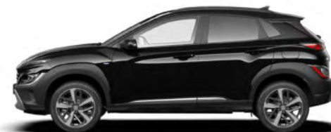
Phantom Black Pearl