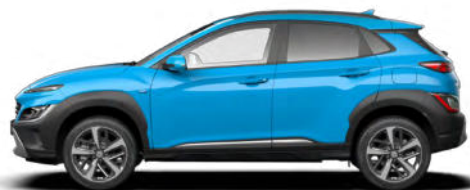
ohne Aufpreis Dive Blue Kontrastdach verfügbar